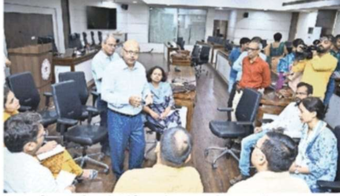
एडवांस प्रशिक्षण कार्यक्रम को संबोधित करते वक्ता।